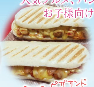
ペニーピザサンド