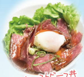
ローストビーフ丼