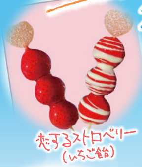
恋するストロベリー (いちご餅)

人気グルメ、ハンドメイドアクセサリー、青空ステージ、 お子様向けの体験型コンテンツが揃います。